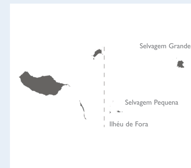
Pormenor dos Arquipélagos da Madeira e das Selvagens, onde a espécie está presente.