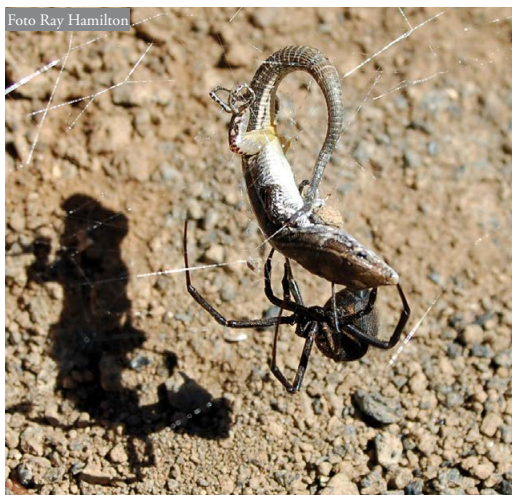
Figura 2: Ejemplar de Latrodectus sp. inmovilizando a un juvenil de G. atlantica cerca de Guinate (Lanzarote, Islas Canarias).

que bordean el valle de Guinate (Lanzarote, Islas Canarias; 29^{\circ}10'25''\text{N}/13^{\circ}29'46''\text{W} ; 435 msnm; Figura 1). Un movimiento brusco llamó su atención y una inspección más cercana le permitió comprobar que un individuo juvenil de G. atlantica había quedado enredado en una tela de araña, en la que se debatía desesperadamente. El propietario de la tela, un ejemplar de viuda negra ( Latrodectus sp.), apareció enseguida tratando de asegurar su captura con más seda (Figura 2). Después de algunos minutos de movimientos compulsivos, el lagarto se detuvo para descansar y el