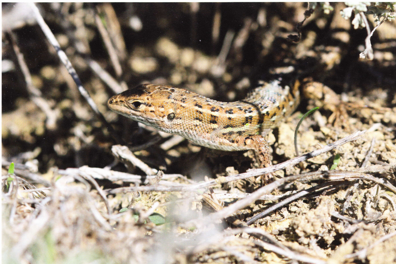
Figure 194: Psammodromus hispanicus , adulte (désert des Bardenas, Navarre, 300 m, 17 octobre 2014).