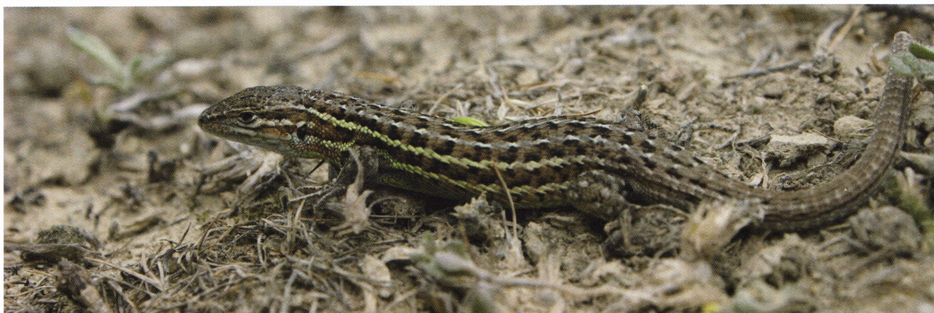
Figure 196: Psammodromus hispanicus , femelle (en haut) et mâle (en bas) des environs d'Andosilla (Navarre, 440 m, 4 mai 2012).