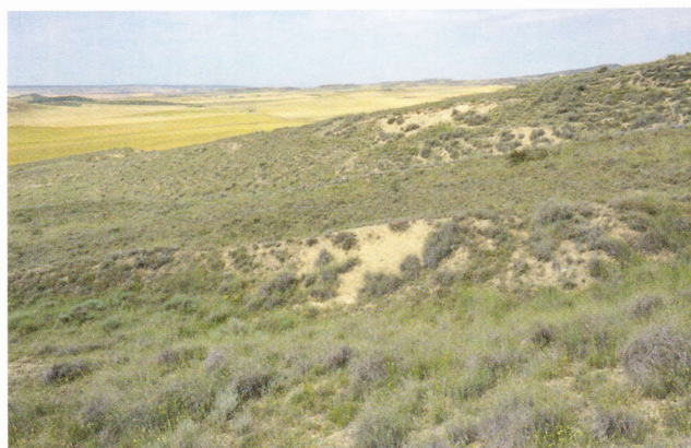
Figure 195: Psammotromus hispanicus , habitat près de Peralta (Navarre, 300 m, 2 juin 2012).

Sa répartition dans le nord de l'Aragon apparaît également obéir à la même exigence de sécheresse et de chaleur, les zones de présence connue figurant parmi les plus arides de cette communauté autonome (Huesca reçoit 53 cm de pluie par an environ et les zones situées au sud encore moins).