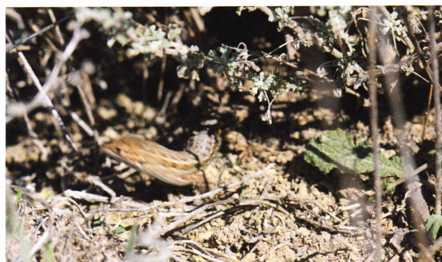
Figure 192: Psammodromus hispanicus , adulte n'ayant pas tenu en place plus d'une seconde, illustrant le surnom de « Sand Racer » donné à l'espèce (désert des Bardenas, Navarre, 300 m, 17 octobre 2014).

Martínez Rica (1983) note que les deux taxons sont peu fréquents au nord de l'Èbre, Catalogne exceptée. Il qualifie leur répartition pyrénéenne de marginale, ces lézards n'investissant réellement les Pyrénées qu'à leur extrémité orientale ( P. edwardsianus ). Il ne fournit pas de valeurs altitudinales.