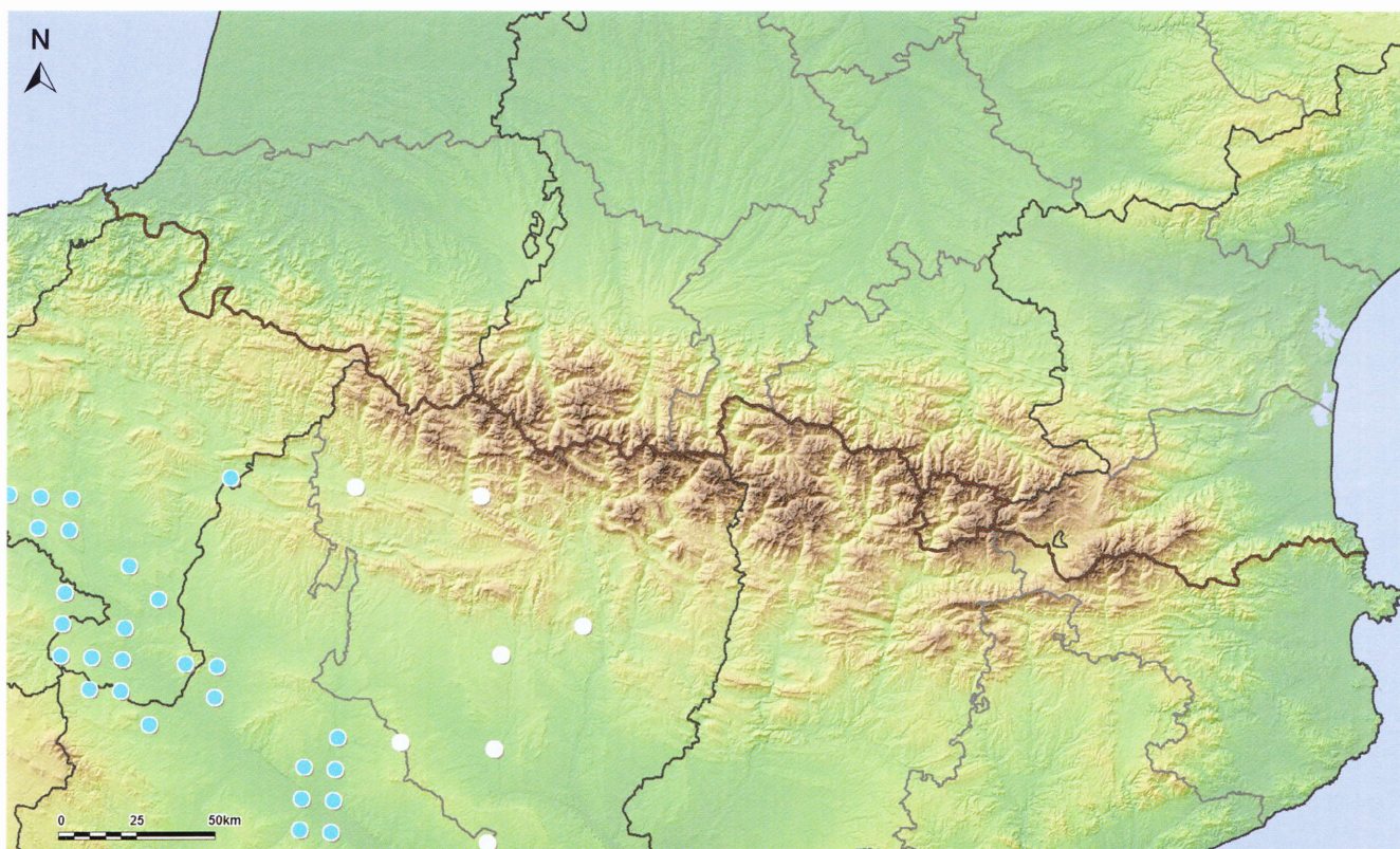
Figure 193: Psammodromus hispanicus , répartition connue dans les Pyrénées (carrés UTM 10 km × 10 km). En blanc : mentions non attribuables avec certitude à P. hispanicus ou P. edwardsianus .