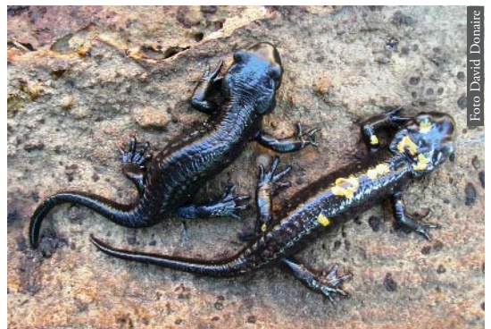
Figura 6. Salamandra algira tingitana de Tagramt, Marruecos.