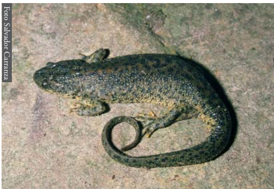
Figura 7. Pleurodeles nebulosus de Ain Draham, Túnez.

e) Por último, en un contexto temporal más próximo, Le Houerou (1992) ha reconstruido el progreso de los límites del desierto del Sahara desde hace 18 000 años, estudiando la vegetación y las dunas fósiles; ha concluido que el límite septentrional del desierto se ha movido hacia el norte durante este periodo, alcanzando la costa del Mediterráneo en el Marruecos Oriental. Ello explica el importante contingente de reptiles saharianos que alcanzan el Mediterráneo en el Rif Oriental ( Uromastix acanthinurus , Acanthodactylus boskianus , A. maculatus , Stenodactylus sthenodactylus , Spalerosophis dolichospilus ; Fahd & Pleguezuelos, 2001), algunos de ellos aproximándose o alcanzando el Estrecho de Gibraltar a través de las áridas costas del Mediterráneo, como Psammophis schokari (Mateo et al. , 2003). En cualquier caso, la distribución de los reptiles a lo largo de la franja del Rif da lugar a un proceso de reemplazamiento de fauna Mediterránea y Paleártica de Oeste a Este, por fauna sahariana de Este a Oeste (Figura 1 en Fahd & Pleguezuelos, 2001). Sin embargo, las especies afectadas por este reemplazamiento apenas se agrupan en corotipos, probablemente como consecuencia que el proceso de colonización de fauna sahariana hacia la costa del Mediterráneo a través del valle del Ued Muluya está aún en un proceso actual y dinámico (Real et al. , 1997).