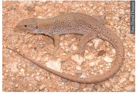
Figura 2. Timon pater de Ifrane, Marruecos.

En relación a la formación del Estrecho de Gibraltar como proceso vicariante, hay algunas especies que han mostrado un dimorfismo morfológico y, sobre todo, una distancia genética, que está en concordancia con el tiempo transcurrido, aproximadamente 5.33 Ma. En anfibios seis de los siete grupos hasta ahora estudiados siguen este patrón vicariante ( Salamandra , Pleurodeles , Alytes , Discoglossus , Pelobates y Pelophylax ); mientras que en reptiles la apertura del Estrecho de Gibraltar parece haber afectado tan solo a seis de los 15 grupos estudiados hasta el momento ( Acanthodactylus , Blanus , Natrix maura , Chalcides , Tarentola y Vipera ). Si el proceso de vicarianza ocurrió para todas las poblaciones de seres vivos presentes en aquel momento en el área del Estrecho de Gibraltar, cabe plantearse porqué unos grupos