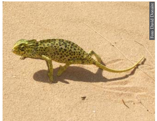
Figura 5. Chamaeleo chamaeleon de Barbate, Cadiz, España.

tanica (Harris et al. , 2004a, c) y Hemidactylus turcicus (Carranza & Arnold, 2006). Testudo graeca ha sido mantenida en semicautividad por diversas culturas Mediterráneas (Fahd & Pleguezuelos, 1996), por lo que no es de extrañar su introducción de forma voluntaria por parte del hombre, como sigue ocurriendo actualmente a través del Estrecho de Gibraltar (Mateo et al. , 2003). Chamaeleo chamaeleon (Figura 5) ha tenido un sentido mágico para el hombre a lo largo de la historia (Blasco et al. , 2001), que continuamente lo ha desplazado a lo ancho del Mediterráneo; incluso, los marcadores moleculares han permitido detectar que las poblaciones ibéricas han tenido un origen doble en época reciente (Paulo et al. , 2002). Los hábitos rupícolas de las sala-