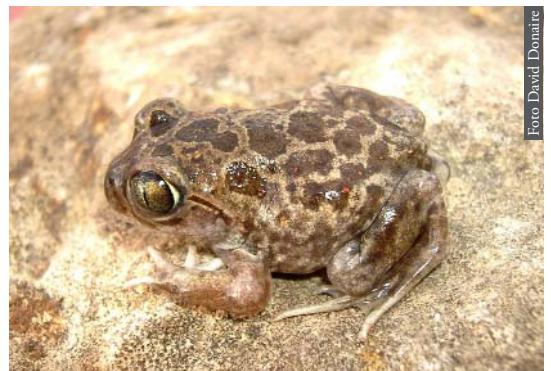
Figura 3. Pelobates varaldii de Kenitra, Marruecos.

En relación a la formación del Estrecho de Gibraltar como proceso vicariante, hay algunas especies que han mostrado un dimorfismo morfológico y, sobre todo, una distancia genética, que está en concordancia con el tiempo transcurrido, aproximadamente 5.33 Ma. En anfibios seis de los siete grupos hasta ahora estudiados siguen este patrón vicariante ( Salamandra , Pleurodeles , Alytes , Discoglossus , Pelobates y Pelophylax ); mientras que en reptiles la apertura del Estrecho de Gibraltar parece haber afectado tan solo a seis de los 15 grupos estudiados hasta el momento ( Acanthodactylus , Blanus , Natrix maura , Chalcides , Tarentola y Vipera ). Si el proceso de vicarianza ocurrió para todas las poblaciones de seres vivos presentes en aquel momento en el área del Estrecho de Gibraltar, cabe plantearse porqué unos grupos