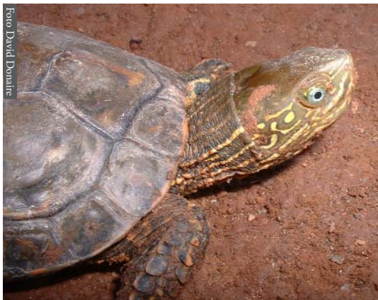
Figura 4. Mauremys leprosa saharica de Ued Masa, Marruecos.

Por último, hay especies con poblaciones en ambas orillas del estrecho que no muestran diferencias morfológicas o genéticas, y que aparentemente no realizan incursiones en el mar; son aquellas que han estado ligadas al hombre