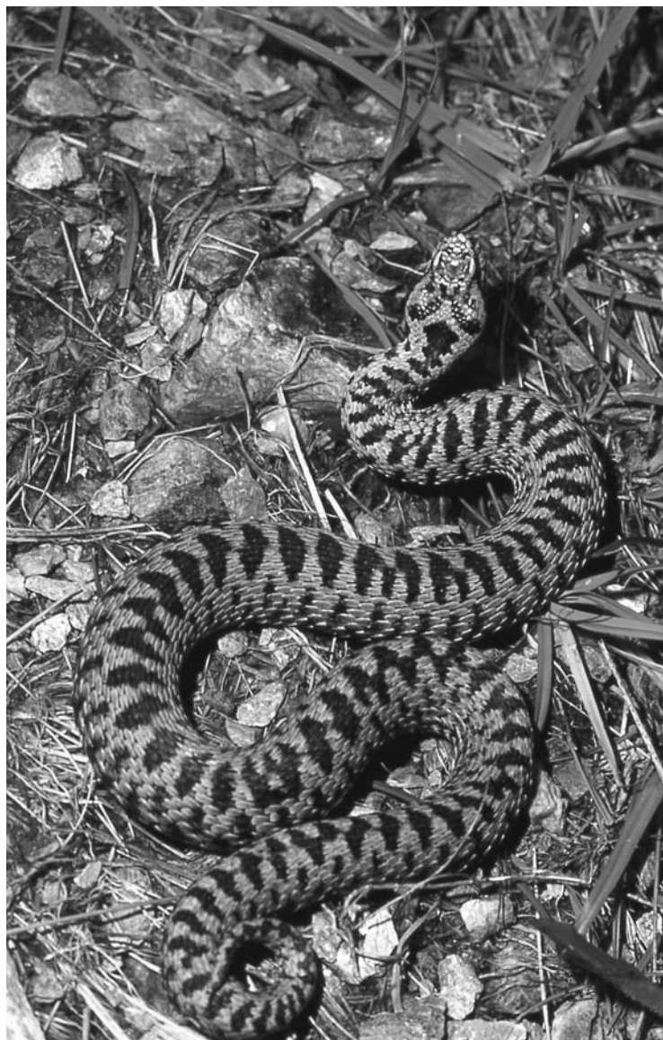
Fig. 2. Esemplare di Vipera berus della Valle Strona (Foto P. Eusebio Bergò, 30/07/2001).

m e 1540 m s.l.m., esposizione SE, 45°56'13"N; 08°13'35"E; f adulta sul ciglio del sentiero che da Campello Monti conduce al Lago Capezzone, 1620 m s.l.m., esposizione SE, 45°56'16"N; 08°13'32"E; 14/08/2002 (SG, obs.), m adulto* a margine del sentiero nei pressi di Alpe Calzino, esposizione E-NE, 1900 m s.l.m., 45°55'25"N; 08°13'29"E; f adulta* a margine del sentiero poco sopra Alpe del Vecchio. Esposizione NE, 1520m s.l.m., 45°55'58"N; 08°13'51"E.; 27/04/2003 (SG, obs.) m ad., sul sentiero tra Alpe Fornale di Sopra e Alpe Fornale di sotto, 1720 m s.l.m., esposizione E, 45°56'52"N;