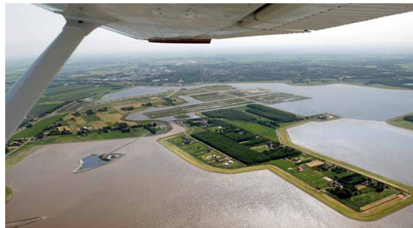
Luchtfoto Blauwestad met op de voorgrond eiland Meerland

Het lastige bij het onder water zetten van een gebied is dat het meestal niet leeg is. Boerderijen en woningen moeten verplaatst worden. De oplossing die men in Blauwestad hiervoor bedacht, is het verplaatsen van de bestaande bewoners naar een eilandje midden in het Oldambtmeer. Met dit eiland, Meerland genaamd, wordt meteen een tweede probleem opgelost: de laatste hoogveenrestanten