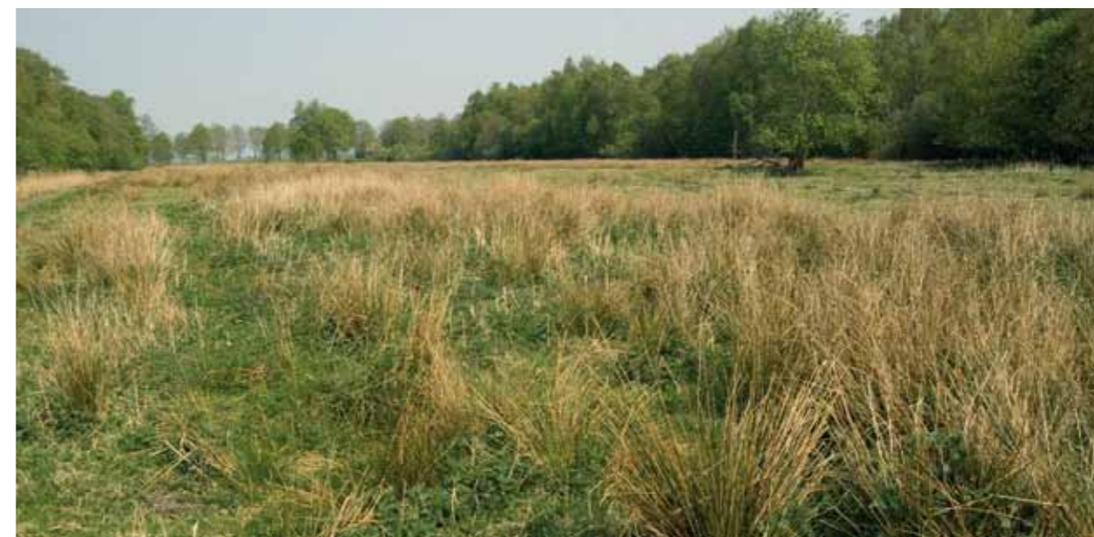
Verschraald grasland waar de hagedissen zijn waargenomen

Ter compensatie voor het verlies aan natuur en als schakel in de Ecologische Hoofdstructuur wordt elders in Blauwestad een nieuw 200 hectare groot natuurgebied ontwikkeld, Reiderwolde genaamd. In 2008 laat de toenmalig gedeputeerde Henk Bleker hier zien wat hij later als staatssecretaris van Landbouw en Natuur bedoeld met “Boeren natuur”. Drie schapenboeren mogen Reiderwolde ontwikkelen; hier geen afgesloten “elitenatuur” maar beleefbare en toegankelijke natuur voor de gewone burger. De hagedissen op het eilandje in het Oldambtmeer zullen Reiderwolde waarschijnlijk niet bereiken. De toekomst van de levendbarende hagedis in Meerland is onzeker. Een deel van de habitat is verdwenen in het meer, het resterende terrein is nog steeds sterk verdroogd. Stichting Gronings Landschap, de huidige beheerder van het natuurgebied, heeft plannen om de waterstand te verhogen. Ook wordt op het eiland