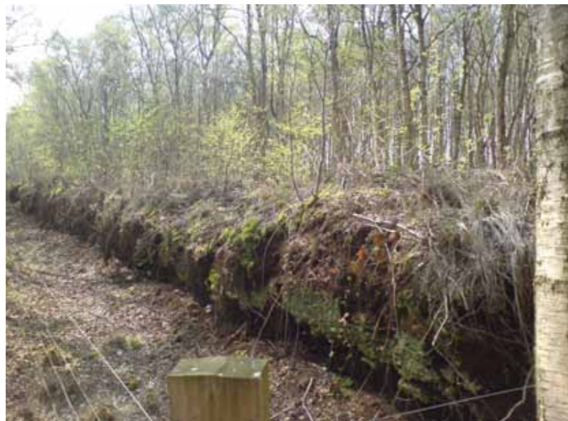
Eén van de hoogveenrestanten in het natuurreservaat