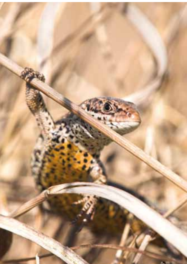
Mannetje levendbarende hagedis

Blauwestad is een groots opgezet gebiedsontwikkelingsproject bestaande uit natuurontwikkeling, waterrecreatie en woningbouw. In 1993 haalde het zelfs de New York Times: "Dutch do the unthinkable: sea is let in" kopte het krantenartikel.