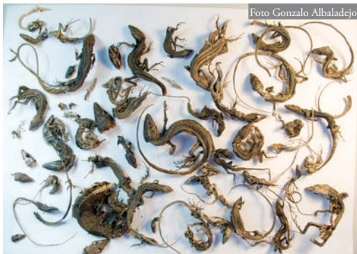
Figura 2: Restos de 42 ejemplares de G. caesaris recuperados del área de estudio antes de su maceración. Tras la maceración de los restos y su análisis se encontraron evidencias óseas (dentarios) de la presencia de ocho lagartos más de pequeño tamaño.

En el caso referido, los testigos de PVC de los muros funcionaron como una trampa pasiva de caída e insalvable para estos animales, que una vez dentro no podían volver a salir. Hay que destacar que uno de los tubos contenía restos de al menos cuatro lagartos diferentes. En este caso, la condición rural del emplazamiento y la existencia de hábitat favorable para el reptil hace poco probable que la continuidad de la población se vea comprometida. Sin embargo, la existencia de estructuras similares en zonas urbanas donde existen pequeñas poblaciones de herpetos, como ocurre en Canarias, puede tener graves repercusiones sobre las mismas.