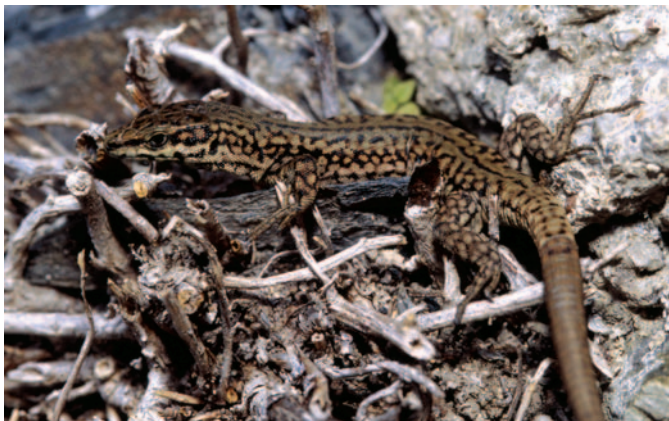
Ambialet (81), alt. 290 m, le 21/04/05

Des études récentes ont révélé que le Lézard hispanique Podarcis hispanicus était en fait constitué d'un complexe d'espèces (Harris et Sá-Sousa 2001, 2002), et nombre de ses anciennes sous-espèces ont en conséquence été élevées au rang d'espèce. Ainsi, les Lézards « hispaniques » de France sont en fait des Lézards catalans Podarcis liolepis , trois sous-espèces étant présentes dans notre pays : P. l. sebastiani (Klemmer, 1964) n'est présent que dans l'extrême sud-ouest (Pays Basque) (Gósa 2002, Geniez et Crochet 2003) ; P. l. liolepis (Boulenger, 1905), de Catalogne, est très logiquement inféodé en France à la seule plaine catalane (Roussillon) (Pyrénées-Orientales) ; P. l. cebennensis Guillaume et Geniez in Fretey (1987) occupe le restant de l'aire de répartition française de l'espèce, toutes les populations de Midi-Pyrénées appartenant donc à cette dernière sous-espèce.