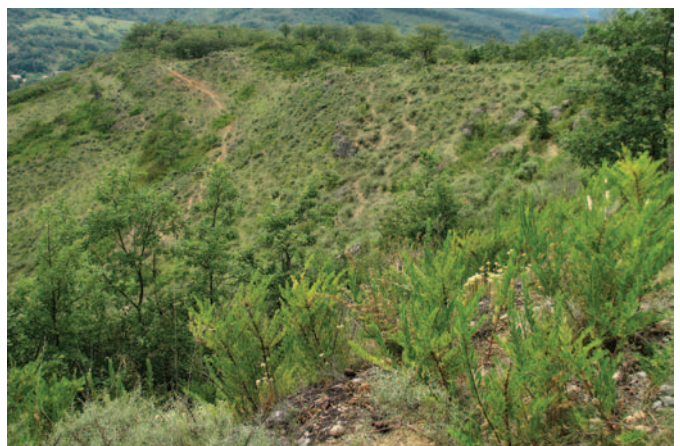
Habitat Dun (09), alt. 400m, le 22/07/07

Dans les Pyrénées ariégeoises et leur piémont, P. liolepis a été inventorié au sein de plusieurs localités nouvelles de la vallée de l'Ariège, du Plantaurel, des coteaux du Mirepessin, etc. qui ont complété de nombreuses lacunes mais n'ont pas sensiblement modifié son patron de distribution connu (Bertrand 2005, O. Calvez, C. Delmas, G. Pottier, M. Tessier, J. Vergne). Dans la vallée de l'Ariège, où il atteint 1300 m sur la commune de Suc-et-Sentenac (versant sud du pic d'Engral) (Bertrand 2005), il ne paraît pas atteindre Ax-les-Thermes, et il semble avoir sa limite entre Auzat et Vicdessos dans la vallée du Vicdessos (Th. Disca in Crochet et Geniez 2000). Il est notable que toutes les localités ariégeoises connues de l'espèce relèvent du bassin versant de l'Ariège, P. liolepis étant inconnu sur