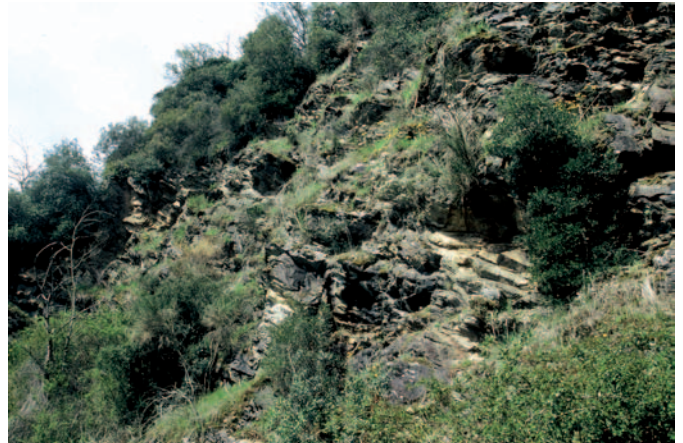
Habitat Vabre (81), alt. 320 m, le 12/09/05

L'espèce reste certainement à découvrir dans de nombreuses autres localités du Massif Central. Les vallées du Tarn, de l'Aveyron et du Lot, et de pratiquement tous leurs affluents, réclament des recherches poussées, notamment partout où existent des peuplements relictuels de végétaux à affinités méditerranéennes. P. liolepis étant capable de se maintenir au sein d'habitats très réduits, aucun talus de route ou escarpement rocheux isolé ne doit être négligé. La limite occidentale de l'espèce mérite également d'être précisée. Manifestement, elle correspond à peu près à la limite des terrains métamorphiques vers l'ouest, P. liolepis étant inconnu sur les terrains sédimentaires (pourtant favorables) du Quercy, de l'Albigeois, du Causse de Caucalières - Labruguière et du Lauragais.