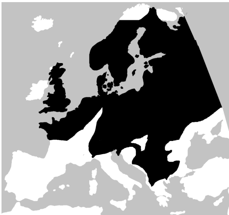
Lisa 5. Hariliku rästiku levila (mustaga tähistatud ala, Wikimedia commons).