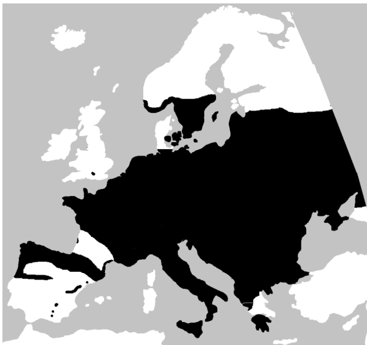
Lisa 7. Silenastiku levila (mustaga tähistatud ala, Wikimedia commons).