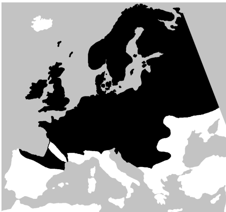
Lisa 4. Arusisaliku levila (mustaga tähistatud ala, Wikimedia commons).