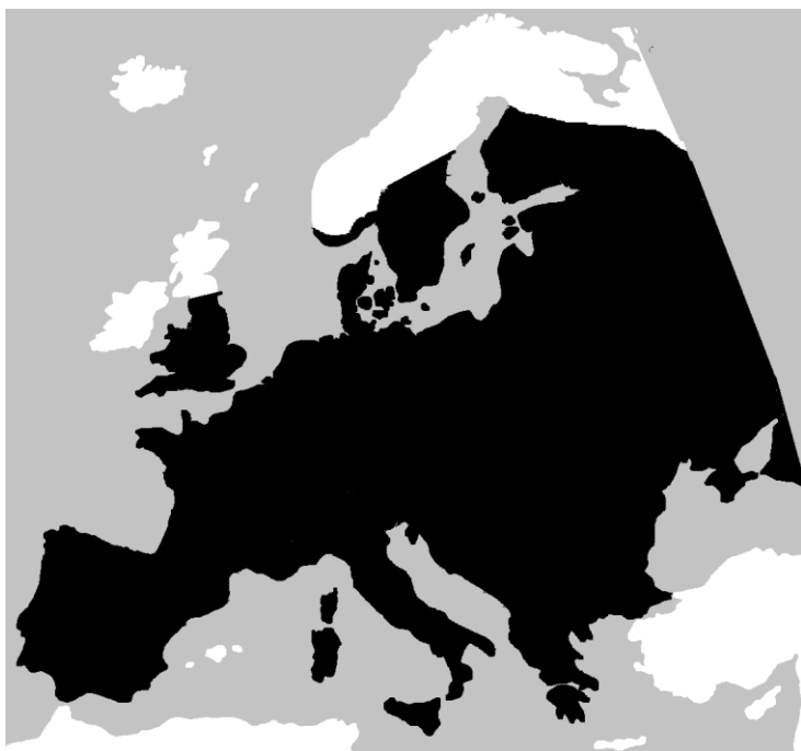
Lisa 2. Hariliku nastiku levila (mustaga tähistatud ala, Wikimedia commons).