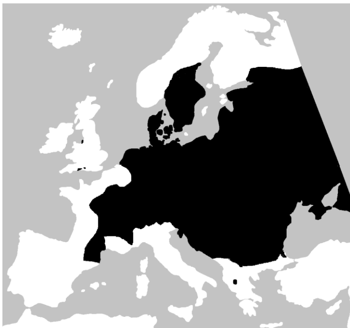
Lisa 3. Kivisalisaliku levila (mustaga tähistatud ala, Wikimedia commons).