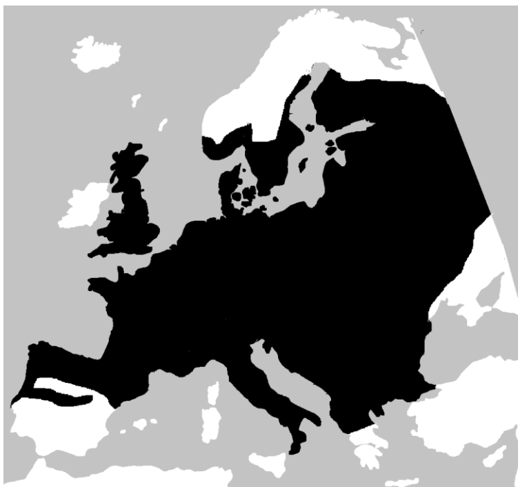
Lisa 6. Vaskussi levila (mustaga tähistatud ala, Wikimedia commons).