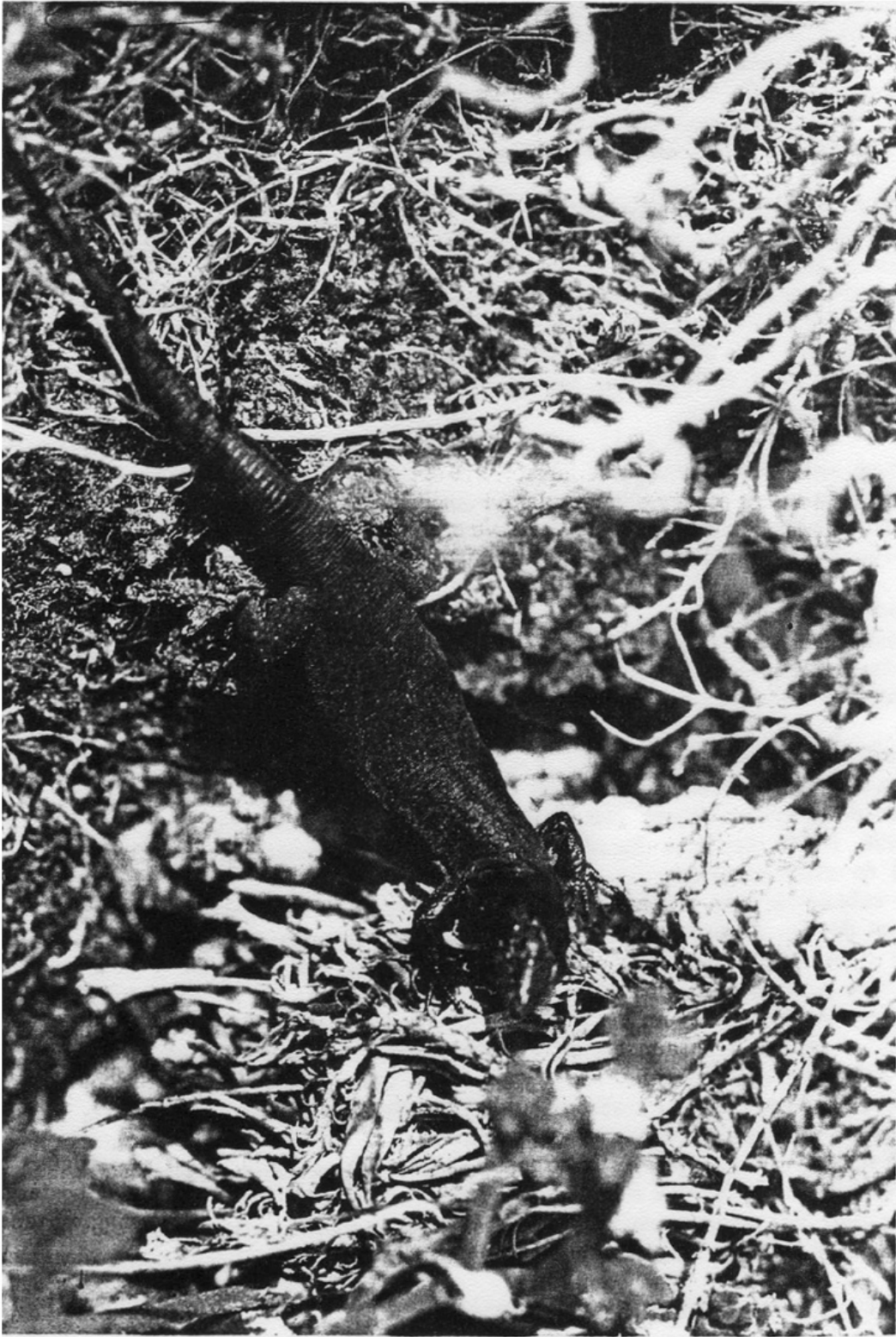
Fig. 2. Podarcis lilfordi xapaticola , Estell de s'Esclata-sang.