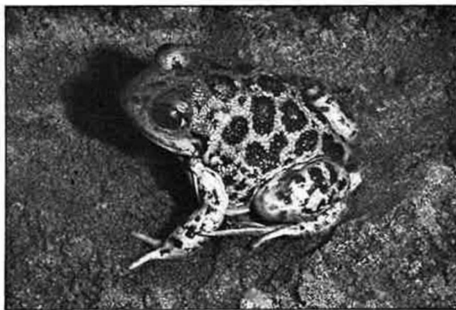
Abb. 4. Pelobates syriacus von der Lagune westlich der Stadt Kos auf der gleichnamigen Insel. — Aufn. O. VON HELVERSEN, 1968.