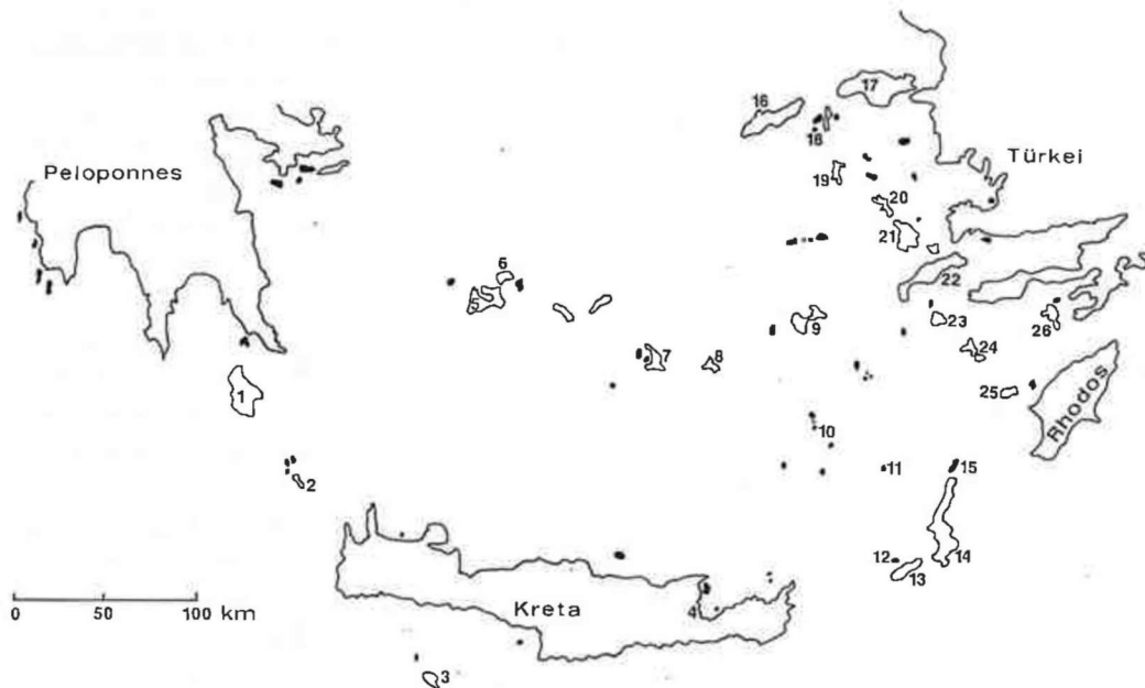
Abb. 1. Karte der südlichen Ägäis mit den erwähnten Inseln.

1966: 2.-12. 3.: Kreta; 13.-20. 3.: Karpathos; 21.-28. 3.: Kos.