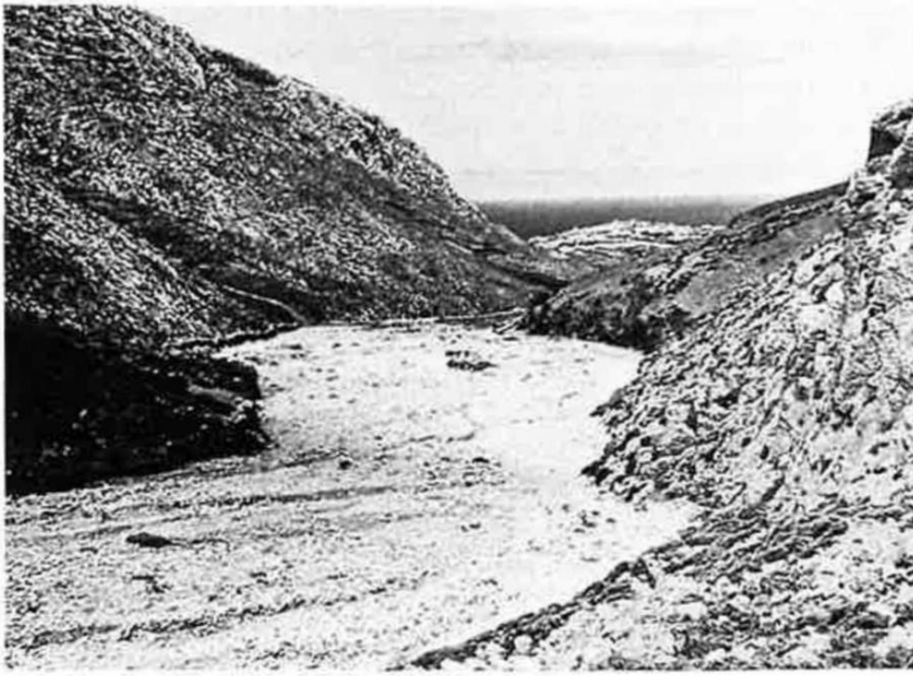
Abb. 2. Torrente Cane südlich von Ofri auf der Insel Kasos.