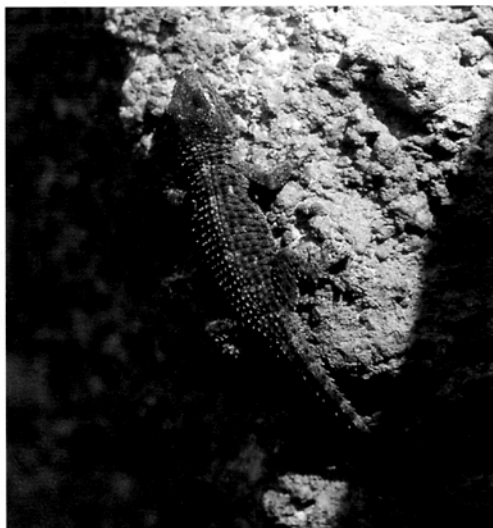
Fig. 4 — Geco comune ( Tarentola mauritanica ) su una roccia lavica della Rupe Falconiera.

de è sintopico con Podarcis sicula , ma utilizza in modalità quasi esclusiva superfici verticali e subverticali.