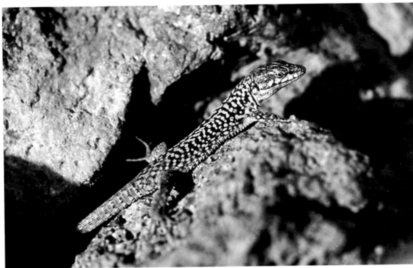
Fig. 5 — Lucertola campestre ( Podarcis sicula ), il Rettile più frequente a Ustica.

piamento si svolga anche due volte nell'arco della medesima stagione riproduttiva (CAPULA et al. , 1993).