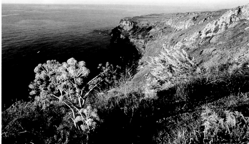
Fig. 1 — Uno scorcio della vegetazione naturale di Ustica.

Specie euro-asiatica, diffusa anche in altre isole minori (S.H.I., 1996; LO VALVO & LONGO, 2002), è stata rinvenuta sull'isola nei pressi dei siti di riproduzione ubicati, in un caso, in una pozza astatica (località Gorgo Salato) e in altri due casi in pozze artificiali utilizzate a scopi irrigui. In una di queste località sono stati contati la sera del 14 aprile 2002 fino a 65 individui adulti. Attività legate alla riproduzione (maschi in canto, accoppiamento, presenza di uova) sono state riscontrate durante tutto il periodo della presente indagine;