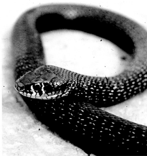
Fig. 6 — Biacco ( Hierophis viridiflavus ), l'unica specie di serpente presente nell'isola.

tuate in cinque casi in ambienti aperti con alternanza di macchia mediterranea, rocce e zone pascolive, in due casi fra le rocce della Rupe Falconiera. In questa località il 22 aprile 2002 è stata osservata la predazione su Podarcis sicula .