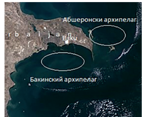
Рис. 1 - Каспийские острова (Бакинский и Апшеронский архипелаги)