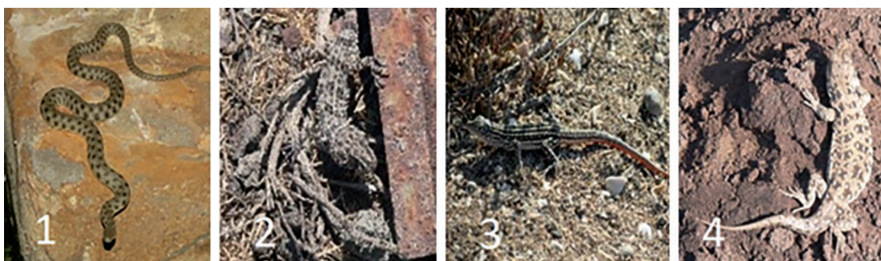
Рис. 5 - Виды рептилий из фауны островов Бакинского архипелага: 1 – водяной уж, Natrix tessellata ; 2 – каспийский геккон, Tenuidactylus caspius incularis ; 3 – быстрая ящурка, Eremias velox ; 4 – разноцветная ящурка, Eremias arguta

На крупных островах Бакинского архипелага нами отмечены те же пять видов рептилий, но азиатский гологлаз встречается только в острове Чикил (табл. 1).