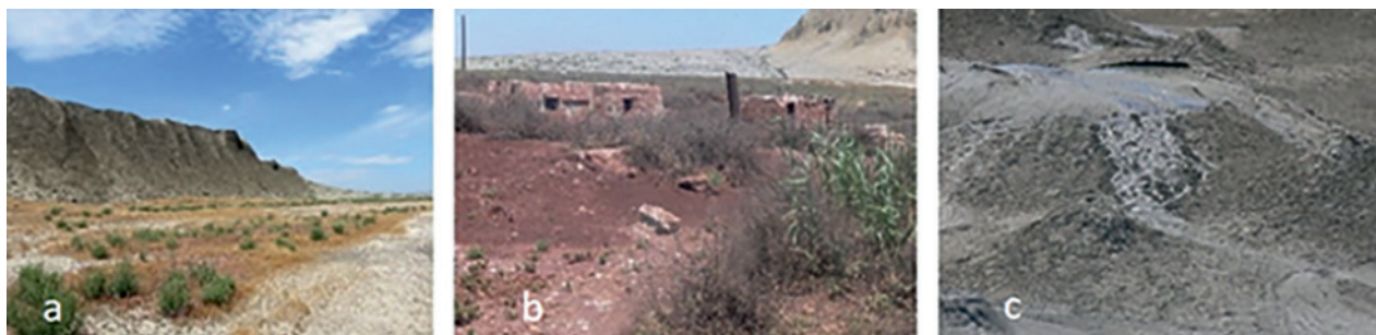
Рис. 4 – Острова Бакинского архипелага – полупустынные равнины и возвышенности с грязевыми вулканами: а – Хара Зира, b – Зембил, с – Карасу

для полупустыни растительный покров, состоящий из эфемерных трав и кустарников, в частности полыни и тамарикса (рис. 4). Острова Бакинского архипелага вулканического и грязе-вулканического происхождения и не имели непосредственного контакта с материком. Однако, по литературным сведениям, около 1200 лет назад такие кратковременные контакты всё же существовали (Якубов и др., 1956).