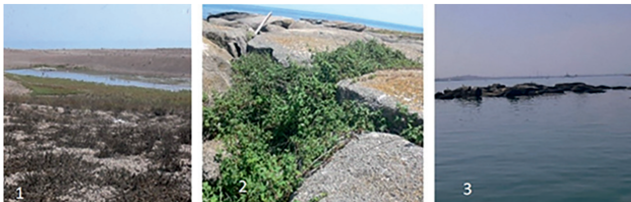
Рис. 2 – Рельеф и растительность островов Апшеронского архипелага: 1 и 2 – Большая Плита; 3 – Малая Плита.

Апшеронский архипелаг. Состоит из островов Чиров, Пир-Аллахи, Игнат Дашы и гряды островков (Большая Плита, Малая Плита). Архипелаг расположен на севере Абшеронского полуострова. В середине прошлого века после строительства дамбы остров Пираллахи соединился с материком и стал полуостровом. Острова Абшеронского архипелага тектонического происхождения, гряда островков сложена, в основном, из скальных плит разных размеров – Большая Плита и Малая Плита (рис. 2).