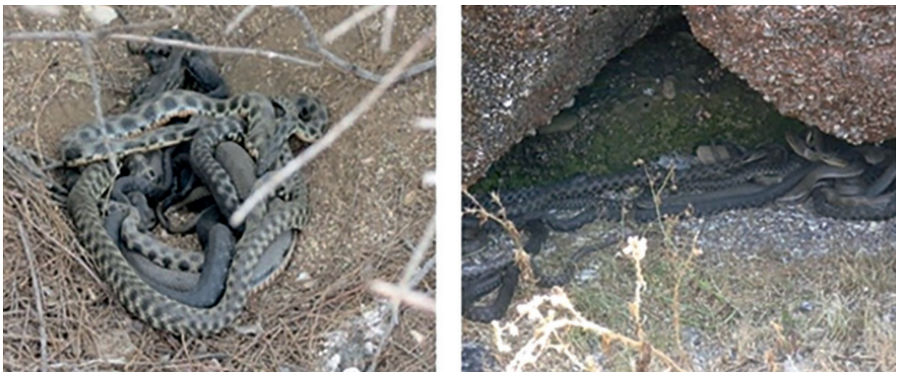
Рис. 3 – Места массового скопления водяного ужа, Natrix tessellata

солянковой растительностью. Восточные берега острова песчаные и открытые, обмываемые волнами. На острове отсутствуют скалистые биотопы, но, вместе с тем, обрывистые, покрытые скоплениями из разных морских выбросов (водоросли, фрагменты деревьев и т.п.) западные и северо-западные берега и площадь территории имеют богатую кустарниковую растительность (тамарикс) и встречаются норы мелких грызунов. Благодаря этому остров является весьма благоприятным для обитания водяного ужа. На экскурсионных маршрутах мы насчитывали до 81 особи ужей, которые встречались отдельными скоплениями по 3–10 особей, греющихся на обрывах берега, и 15 отдельных особей, укрывавшихся в тени кустов (см. рис. 3). На этом острове встречается и разноцветная ящурка. Не исключено, что она попала на остров с материковой части (Шахова коса) в периоды понижения уровня моря.