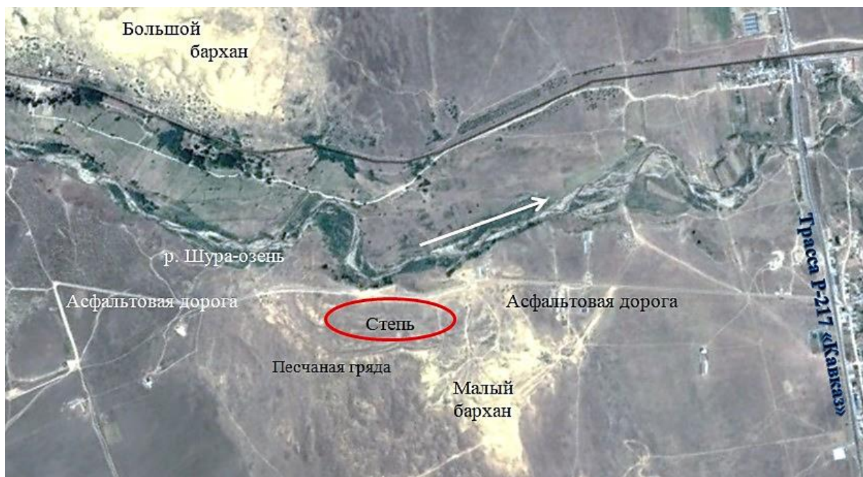
Рис. 5. Участок территории около малого Сарыкумского бархана, на котором мы изучали разноцветную ящурку (в красном овале). Белая стрелка показывает направление течения реки. Рисунок построен с применением программы Google Earth

Мы решили оценить обилие разноцветных ящурок в степи около малого Сарыкумского бархана через абсолютную численность и абсолютную плотность популяции ящурок. В отличие от ситуации с ушастыми круглоголовками, население выбранного нами участка степи не было четко изолировано от ящурок, населяющих окружающие пространства степи. Этот участок был выбран произвольно, по принципу удобства и доступности.