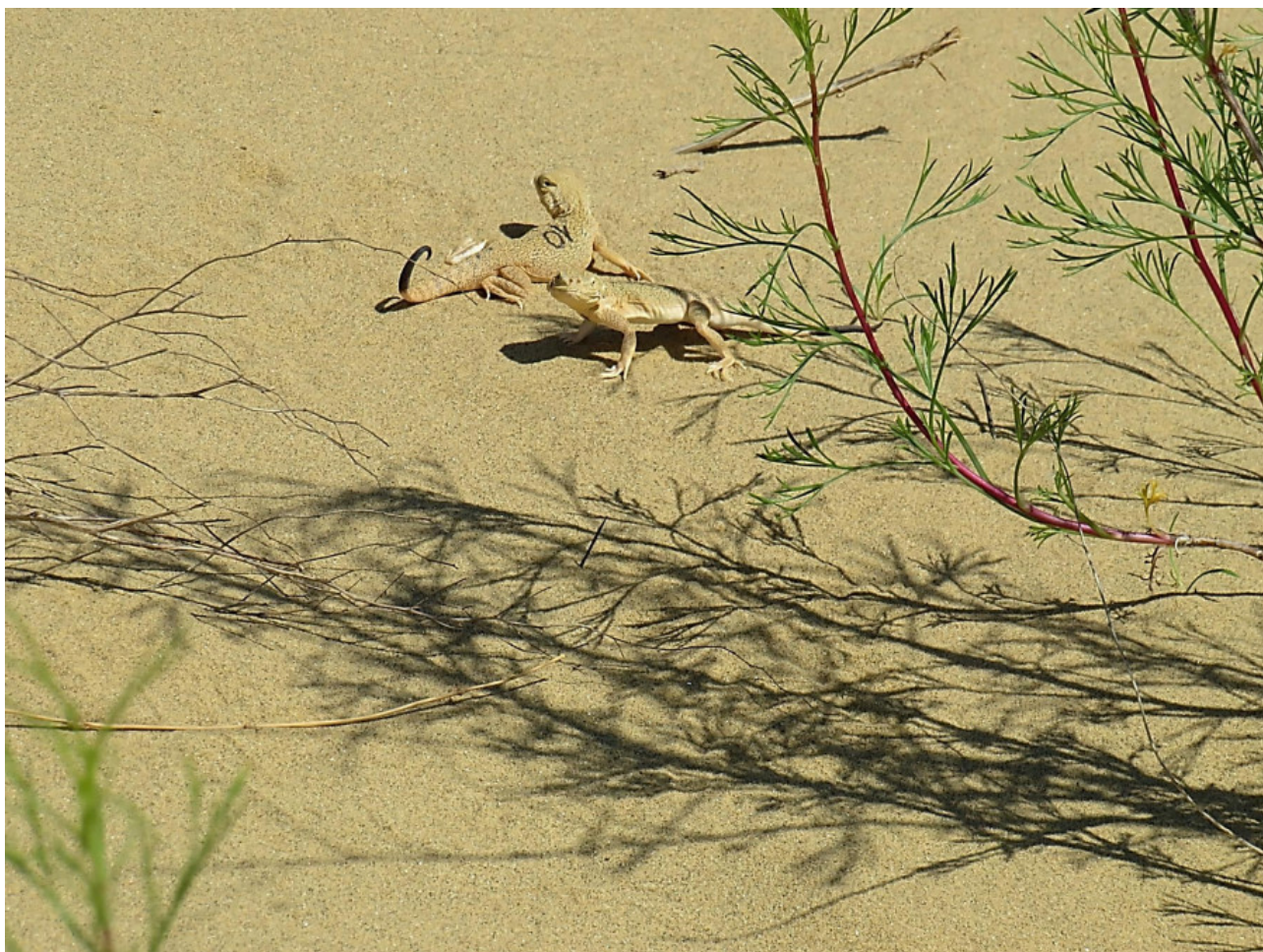
Рис. 2. Ушастая круглоголовка, помеченная номером Fig. 2. Toad-headed agama marked with a number

Важно определенным образом учитывать неравномерность распределения животных по изучаемой территории (Коли, 1979). В нашем случае ушастые круглоголовки распределяются по бархану в соответствии с типами биотопов. Прежде всего они избегают заросших травой участков. Но на бархане имеется некоторое количество различающихся биотопов, на которых круглоголовки наиболее часто встречаются: это открытые, развеваемые песчаные территории, также активно используются участки, слабо заросшие такими растениями, как, например, волоснец кистистый ( Leymus racemosus ), жузгун безлистный ( Calligonum aphyllum ) и др. Учитывая это обстоятельство, мы разбили территорию бархана на зоны, внутри которых плотность населения круглоголовок примерно одинакова. Согласно рекомендациям Г. Коли (1979), это соответствует методическому процессу стратификации, а выделенные однородные зоны можно назвать стратами.