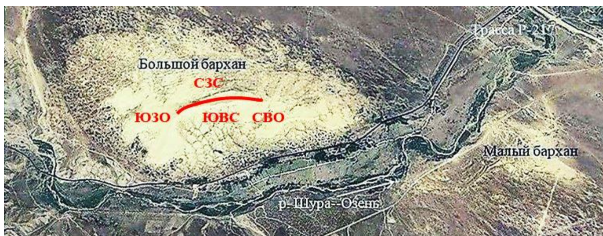
Рис. 1. Расположение большого и малого Сарыкумских барханов и схема большого Сарыкумского бархана и его окрестностей. Красной полосой отмечен гребень большого бархана между двумя его высшими точками. СВО – северо-восточная оконечность бархана, ЮЗО – юго-западная оконечность бархана, ЮВС – юго-восточный склон бархана, СЗС – северо-западный склон бархана. Рисунок построен с применением программы Google Earth

Итак, для оценки состояния популяции ушастой круглоголовки мы выбрали изолированную популяцию большого Сарыкумского бархана. Ранее круглоголовки населяли и малый бархан, но сейчас они там не встречаются (рис. 1).