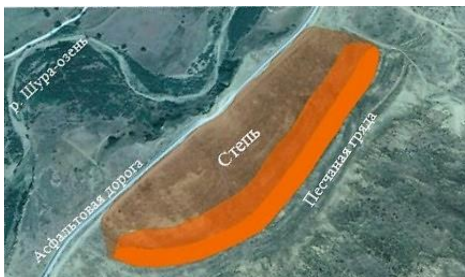
Рис. б. Участки, прилегающие к малому Сарыкумскому бархану, использованные нами в расчете численности популяции разноцветных ящурок. Участок плотного проживания разноцветных ящурок отмечен на рисунке ярко-красным цветом (учетная полоса) и средне-прозрачным розовым цветом; самым прозрачным розовым цветом показан участок до асфальтовой дороги, на котором ящурки встречаются, но плотности их обитания на нем ниже, чем на двух предыдущих, и к тому же

Для учета численности разноцветных ящурок мы использовали следующий прием. Три человека просматривали полосу степи шириной 35–40 м (примерно по 10–15 м на человека), длина этого учетного маршрута составляла 800 м. Площадь просматриваемой территории оказалась примерно 30000 м 2 , т. е. 3 га (см. рис. б).