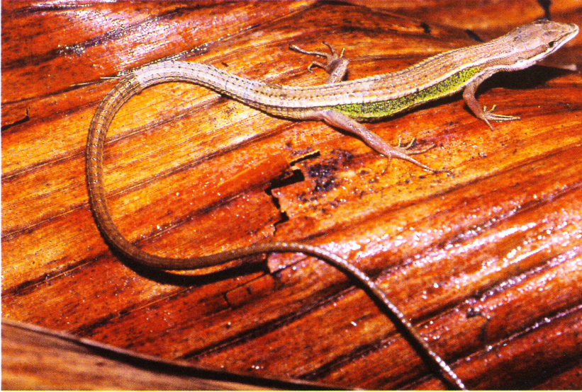
T. formosanus , Taiwan.

Beschreibung: Kopf 1,6- bis 1,75-mal so lang wie breit. Drei Paare von Unterkieferschilden, selten vier; vier Supraocularia, das erste sehr klein; vier bis fünf Supraciliaria; zwischen Supraocularia und Supraciliaria eine Reihe von Granula, die oft vollständig ist; ein Postnasalschild; Rostrale berührt nicht das Nostril, ist