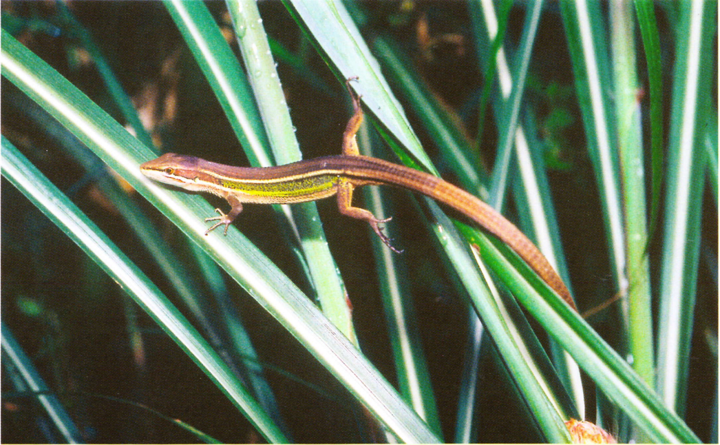
T. formosanus ist meist sehr ansprechend gefärbt.

schuppen durch ein Gebiet aus Körnchen-schuppen; 33–38 Schuppen um die Rumpfmittle. Präanalschild mit kleinen gekielten Schuppen vorne und an den Seiten. Zwei Femoralporen auf jeder Seite (STEJNEGER 1907, BOULENGER 1917, CHENG 1987).