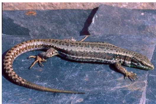
Figura 2. Hembra de Iberolacerta galani . © Oscar Arribas.

Hembras (fuera del periodo de celo, de Sierra Segundera, Trevinca y Teleno) : Dorso de color verde pálido a verde grisáceo en los adultos. Diseño mucho menos manchado que en los machos y con un grado de desarrollo no correlacionado con la edad (las hembras viejas pueden tener o carecer del moderadamente desarrollado diseño dorsal). Usualmente un moteado irregular o vermiculado en el centro del dorso, que puede extenderse a todo lo ancho del tracto dorsal o estar claramente alineado en dos hileras. Bandas temporales no reticuladas sino uniformes, con sus áreas marginales (especialmente el reborde superior) más oscuras (prácticamente negras) y el área interior de las bandas más clara (marrón). Borde superior de esta banda temporal (=costal) también aserrado, encerrando puntos más claros, más visibles en los animales jóvenes, pero también en los adultos. Las hileras de puntos claros en las partes inferiores de los costados menos marcadas, así como la línea lateral inferior, que es borrosa y raramente aparece en forma de manchas. Vientre verde amarillento. Ocelos azules como en los machos pero menos abundantes y más pequeños. Contrariamente a los machos, el moteado negro aparece usualmente en el centro (o en las partes posteriores) de las escamas ventrales de las hileras de escamas ventrales más externas, y frecuentemente está casi borrado. Más raramente existen pequeños puntos en la segunda hilera más externa de ventrales (Arribas et al., 2006).