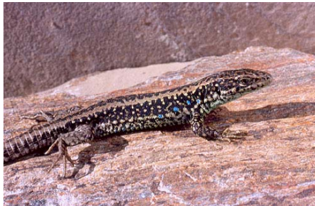
Macho de Iberolacerta galani .