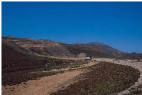
Figura 1. Hábitat de Iberolacerta galani . El Morredero (León).

Los substratos rocosos que habita son bastante diversos: en Sanabria y la Sierra de la Cabrera vive sobre rocas ígneas poco fisuradas (granitoides “Ollo de Sapo” y otros de tipo sincinemático de edades inciertas); en el Teleno y Trevinca vive sobre lajas de pizarras negras del Ordovícico Medio, muy apreciadas para la construcción, lo que podría constituir un peligro para su conservación en algunas áreas; y en las cumbres de estas sierras (Teleno y Cabrera) viven sobre las duras cuarcitas armoricanas que constituyen los materiales resistentes a la erosión de estos picos.