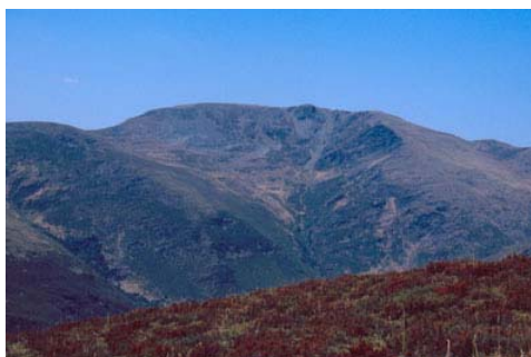
Figura 2. Hábitat de Iberolacerta galani . Sierra del Teleno (León).

Las áreas inferiores actualmente habitadas por I. galani probablemente han sido colonizadas por la especie en tiempos históricos, a raíz de la destrucción del bosque para la obtención de pastos. Igualmente, la especie puede habitar la vegetación azonal por debajo de su límite altitudinal en situaciones especialmente favorables de temperatura y humedad, como en cañones fluviales. Estas zonas bajas se incluyen en las series Supramediterráneas y Altimontanas Estrellense, Orensano-Sanabriense y Galaicoportuguesa silicícola de Betula celtiberica o abedul ( Saxifraga spathularidi-Betuleto celtibericae sigmetum ) y están constituidas por los límites superiores del bosque, usualmente destruidos como resultado de los fuegos. Sus estados regresivos, habitados por I. galani , son piornales de Cytisus striati - Genistetum poligaliphyllae , que a su vez son reemplazados por brezales Genistello tridentatae - Ericetum aragonensis (Navarro-Andrés y Valle-Gutierrez, 1987; Rivas Martínez, 1987).