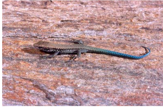
Figura 3. Recién nacido de Iberolacerta galani .