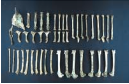
Figura 8: Huesos de Puffinus mauretanicus procedentes del yacimiento de Es Pouàs.