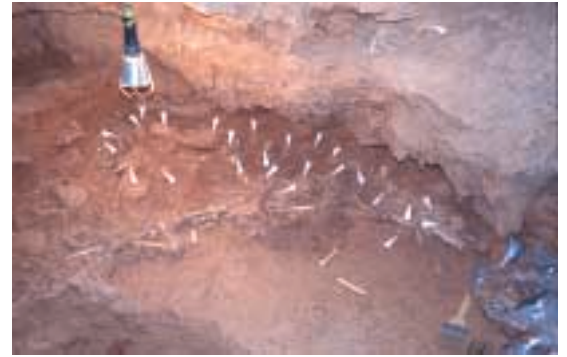
Figura 1: Vista de la excavación de la Cova des Moro (Manacor, Mallorca). Se ha exhumado un nivel paleontológico que consiste en un auténtico cúmulo de huesos de M. balearicus . Cada una de las flechas blancas indica la posición de un cráneo de esta especie.

En el campo de la Paleontología, las cuevas son lugares que tienen un interés especial (SUTCLIFFE, 1976; ALCOVER, 1992). Por un lado, muchos de los elementos bióticos y abióticos que actúan en el exterior dificultando o impidiendo los procesos de fosilización, no actúan en el interior de las cavidades facilitando, en consecuencia, la fosilización. Por otro lado, como parte de los sistemas de drenaje de las aguas en las zonas kársticas, las cavidades y, en menor grado, las fisuras kársticas, suelen actuar como trampas de sedimentos y de fósiles, facilitando así grandes acumulaciones (ver, por ejemplo, la Figura 1). Además, muchas veces existen agentes bioacumuladores, como pueden ser por ejemplo las aves de presa que se posan habitualmente en las paredes o grietas de las cuevas, que incorporan a los yacimientos grandes cantidades de pequeños vertebrados (ANDREWS, 1990). Las cuevas son, por tanto, lugares muy propicios a contener yacimientos fosilíferos, especialmente de vertebrados, pero también de otros grupos, como, por ejemplo, moluscos o incluso insectos o diplópodos. Algunas cuevas contienen millones de huesos de vertebrados, acumulados en