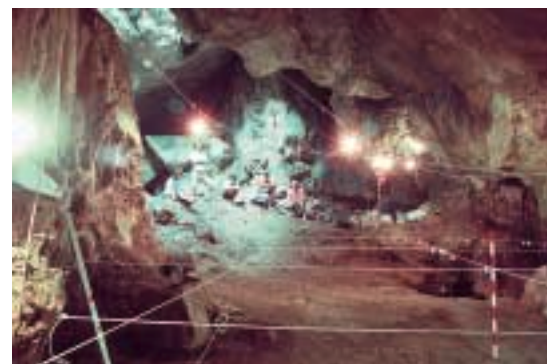
Figura 7: Aspecto general de la excavación de Es Pouàs (Sant Antoni de Portmany, Eivissa).

Otra de las informaciones obtenidas a partir del estudio de los coprolitos proviene de la fina textura de las partículas que contienen. Si se compara el tamaño de estas partículas en los excrementos de M. balearicus con el tamaño de las partículas en los excrementos de otros bóvidos actuales (tales como oveja y cabra), se puede ver que en los excrementos de Myotragus no se aprecian fibras vegetales a simple vista, sino que los excrementos están compuestos por un polvo fino (el 95% del peso seco de los coprolitos consiste en partículas inferiores a 500 \mu m), mientras que en los de cabra y oveja, se observan claramente fibras vegetales grandes, y analizando excrementos de cabras de la zona de la Cova Estreta, se ha visto que el 50% de su peso seco son partículas de más de 500 \mu m. El tamaño de las partículas de los coprolitos de M. balearicus sugiere una gran eficiencia de los procesos digestivos. Parece, pues, que el boj