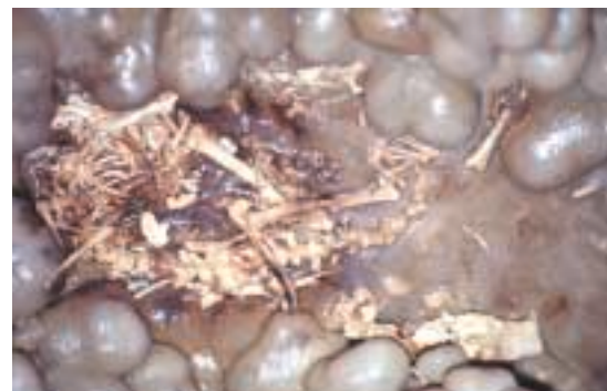
Figura 5: Esqueleto asociado de Eliomys morpheus encontrado en la Cova des Penyal Blanc (Cabrera).

La medida de M. balearicus era muy reducida, de no más de 50 cm en la