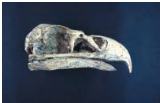
Figura 2: Cráneo de pigargo ( Haliaeetus albicilla ). Era el superdepredador de la fauna pleistocénica de Eivissa.