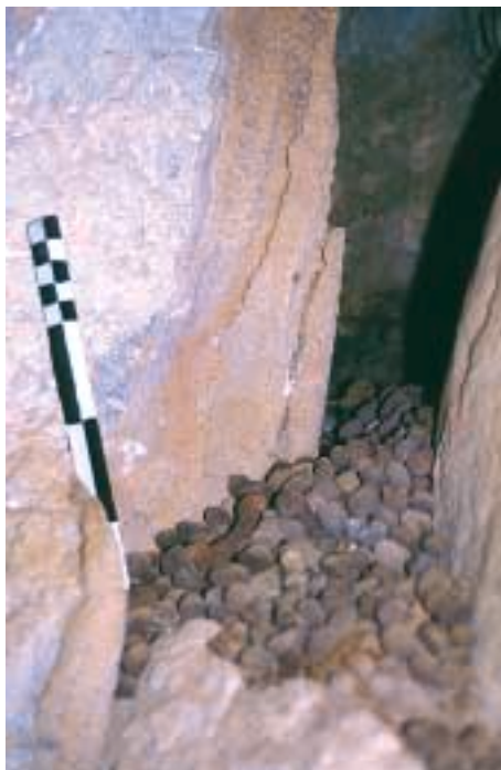
Figura 4: Coprolitos de M. balearicus procedentes de la Cova Estreta (Pollença, Mallorca).