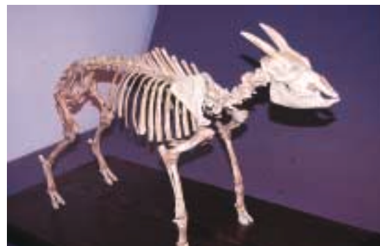
Figura 3: Esqueleto muntat de Myotragus balearicus . Figura 3: Esquelet muntat de Myotragus balearicus . Figure 3: Myotragus balearicus mounted skeleton.

Establecer la cronología de los materiales paleontológicos que nos han aportado los yacimientos espeleológicos de las Baleares constituye el reto más importante para entender cual ha sido la evolución de la fauna insular de vertebrados (e invertebrados). Se dispone de un pequeño corpus de dataciones radiocarbónicas directas, realizadas sobre huesos de M. balearicus y de E. morpheus , que han permitido establecer una cronología bastante precisa para los diferentes depósitos del Pleistoceno superior y Holoceno. En lo que hace referencia a los materiales más antiguos, aunque se dispone de algunas dataciones isotópicas y paleomagnéticas claves que han permitido situar cronológicamente algunos materiales, el corpus de dataciones absolutas disponibles es muy pobre. Las cronologías que se han propuesto se han basado en paralelismos morfológicos entre los diferentes taxones de vertebrados e invertebrados obtenidos, en el análisis de las tendencias evolutivas existentes (dataciones relativas), en análisis sedimentológicos, en el grado de fosilización de los restos obtenidos (PAUL & ALTABA, 1992), y en análisis faunísticos y biogeográficos globales (ALCOVER et al., 1999a).