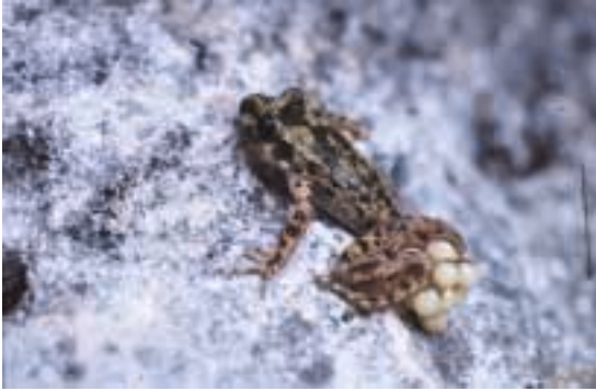
Figura 6: Ferreret, amfibi endèmic de Mallorca que fue descrito inicialmente como fòssil a partir de materiales procedentes de la Cova de Moleta y de la Cova de Son Bauçà. El año 1980 se descubrió que la especie todavía sobrevivía en las montañas de Mallorca0 (Foto G. Alomar)

Figura 6: Ferreret, amfibi endèmic de Mallorca que va ser descrit inicialment com a fòssil a partir de materials procedents de la cova de Moleta i de la cova de Son Bauçà. El 1980 es va descobrir que l'espècie encara sobrevivia a les muntanyes de Mallorca. (Foto G. Alomar)