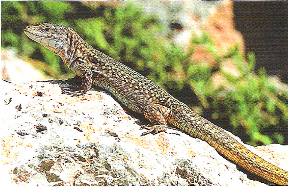
Abb. 2: Podarcis pityusensis pityusensis , Männchen von Ibiza