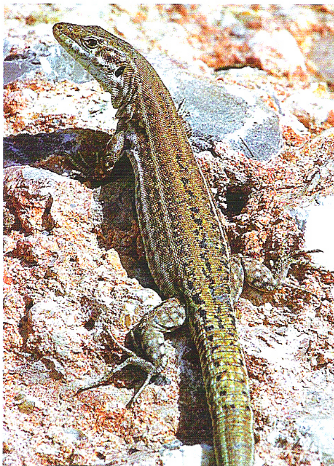
Abb. 1: Podarcis pityusensis pityusensis , Weibchen von Ibiza

Größere Mengen an geeigneten Futterinsekten sucht man hier zumeist vergeblich, was sicherlich schon durch die geringe Größe der Eilande zu erklären ist. Das Insektenvorkommen ist zudem weitgehend von der Vegetation abhängig, und diese besteht auf den meisten Inselchen nur aus einigen wenigen Charakterpflanzen. Der felsige Bodengrund ist oftmals stark verwittert und in der Regel recht arm an Humus. Dies hat wiederum zur Folge, daß sich Regenwasser nicht in einem Bodengrund sammeln kann und stattdessen in Felsspalten versickert. Die Pflanzenwelt findet somit nur sehr einseitige Lebensbedingungen vor, und die Inseln machen angesichts der verarmten Flora einen recht trockenen und öden Eindruck. Da die Insekten letzten Endes auf die Vegetation angewiesen sind, ist es nicht verwunderlich, daß es auf diesen Inseln neben einer Verarmung der Flora auch zu einer Verarmung des Insektenlebens gekommen ist. Die Eidechsen konnten sich durch eine Umstellung an eine erhöhte Nutzung der pflanzlichen Nahrungsressourcen in diesen Lebensräumen erfolgreich behaupten. Im Folgenden sollen ei-