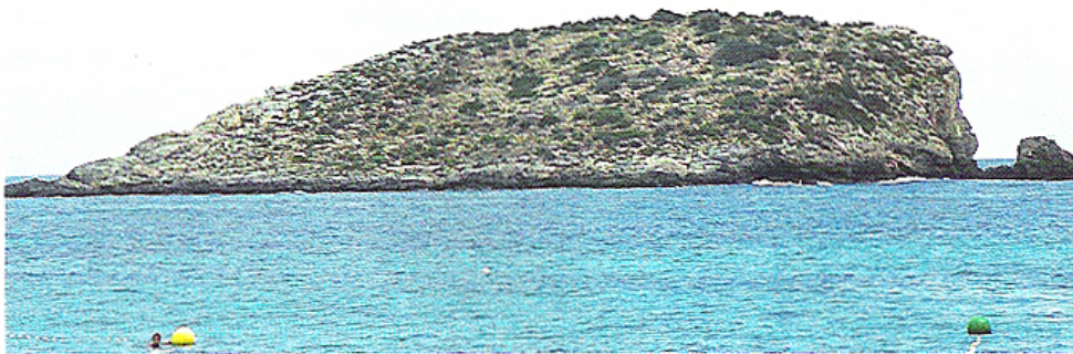
Abb. 3: Die Insel Isla Es Canar als Beispiel für die extrem kleinen echsenbewohnten Inseln

Von 32 direkt von Ibiza stammenden Tieren wiesen 71,9% einen rein animalischen, 21,9% einen gemischten und 6,2% einen rein vegetarischen Mageninhalt auf. 60