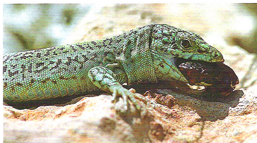
Von oben nach unten: Abb. 8 & 9: Podarcis pityusensis mit einer ungewöhnlichen Beute: einem nestjungen Vogel Abb 10: Podarcis pityusensis sind süchtig nach süßem Obst From top to bottom: Fig. 8 & 9: Podarcis pityusensis with an unusual prey: a young bird Fig. 10: Podarcis pityusensis are crazy about sweet fruit

Es war uns zuvor relativ unverständlich, warum Bauern die Pityuseneidechsen teilweise unerbittlich bekämpfen. Nach dieser Beobachtung konnten wir Aussagen, daß die Eidechsen infolge ihrer Menge doch einigen Schaden anrichten können (MEYER 1951), einigermaßen glaubhaft nachvollziehen. Unserer Meinung nach mußte man wirklich um den gesamten Aprikosenbestand dieses Baumes fürchten. Auffällig war die geringe Aggressionsbereitschaft der Echsen untereinander. Da hier die Nahrung im Überfluß vorhanden war, stellten die Artgenossen keine wirklichen Futterkonkurrenten dar. Eine ähnliche Beobachtung konnten wir auf der westlich von Ibiza liegenden Insel Es Vedrá machen. Hier tummelten sich bis zu 30 oder 40 Eidechsen in einem Radius von etwa zwei Metern um eine von uns ausgelegte Frucht, ohne dabei wirklich voneinander Notiz zu nehmen.