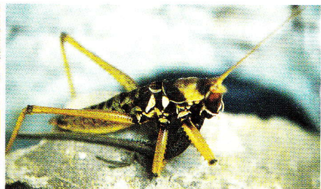
Abb. 2. Saga ephippigera -Männchen auf den syrischen Golan-Höhen beim Verzehr eines männlichen Ophisops elegans ehrenbergii .

Angriff wurde von der Heuschrecke mit höchster Präzision und derart überraschend durchgeführt, dass die Eidechse nicht die geringste Chance zum Entkommen hatte.