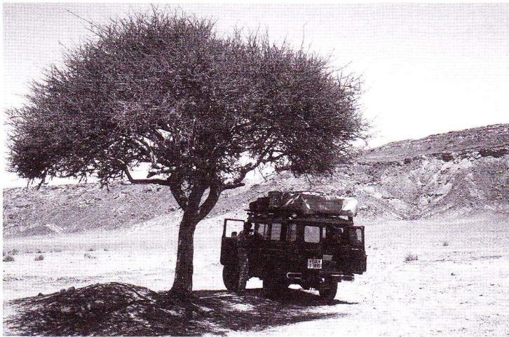
Abb. 2. Im Lebensraum von M. rubropunctata im Tademait-Plateau, Algerien.

Ich fand die Art im zentral-algerischen Tademait-Plateau zwischen El Golea und Timimoun. In dieser endlos erscheinenden Fels- und Gerölllandschaft, die nur durch einige vereinzelt Akazien aufgelockert wird (Abb. 2), waren die Eidechsen zwischen den Steinen zu finden.