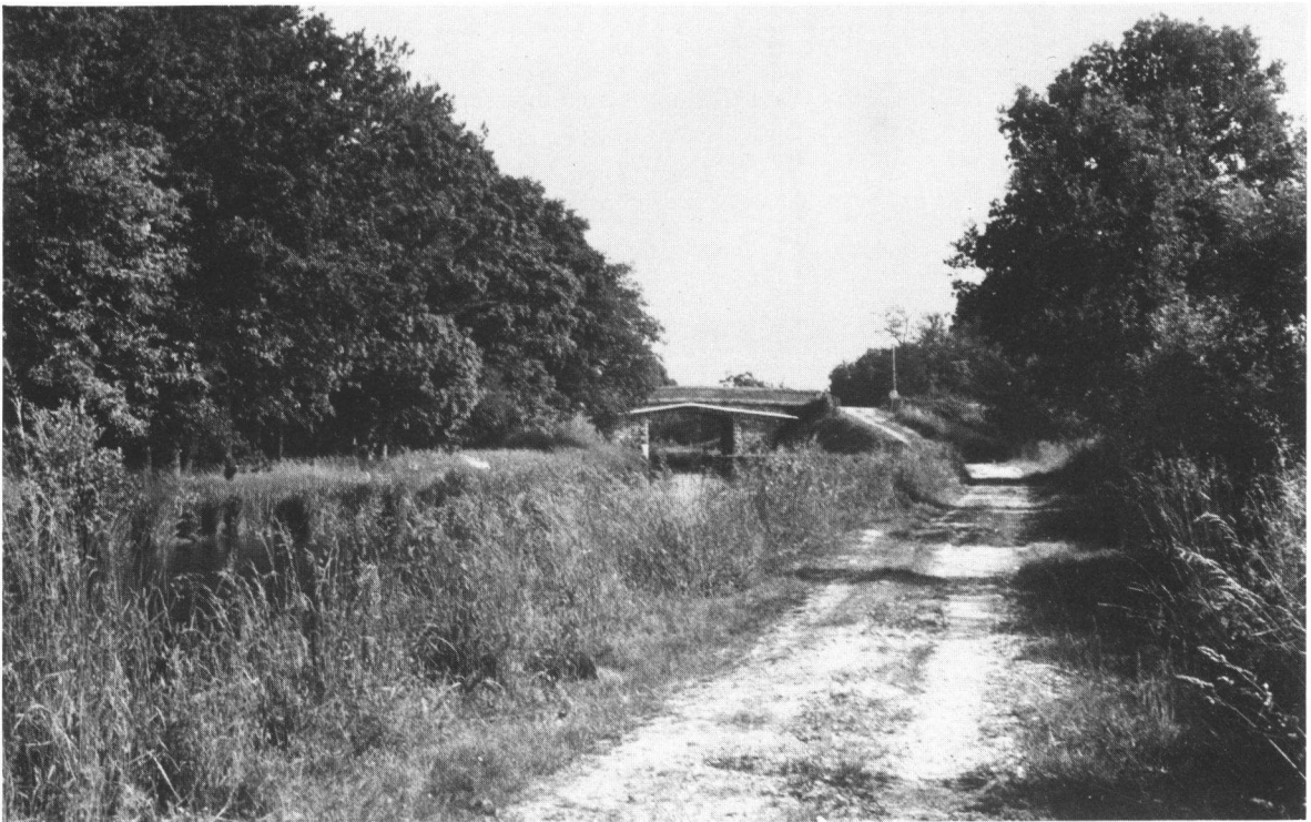
Fig. 1. Vue du canal et de la partie méridionale de la zone d'étude, prise au sud du pont, à l'emplacement indiqué par un triangle sur la Fig. 2b.

chiffre figurant après la moyenne est l'écart type ( \sigma ) et non l'erreur standard. L'effectif des populations d'adultes et de subadultes a été calculé, d'après les résultats des captures-recaptures à court terme, selon l'équation proposée par Bailey (1952) pour les petits nombres. Selon les cas, les Lézards effectivement capturés représentaient entre 75,6 et 86,14% de l'effectif théorique.