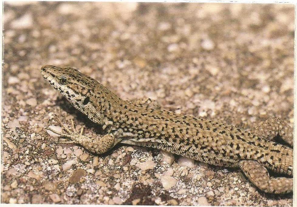
Forme « petite » (Valros, Hérault, août 1984).

habite surtout la Catalogne espagnole et les Pyrénées jusqu'à une altitude de 1 100 m, et pénètre dans les Pyrénées-Orientales (Fontpedrouse, Banyuls) où ses populations vivent parfois en sympatrie avec P. muralis .