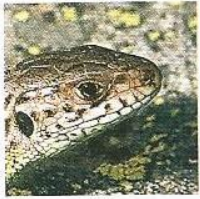
Lucertola agile Sand lizard