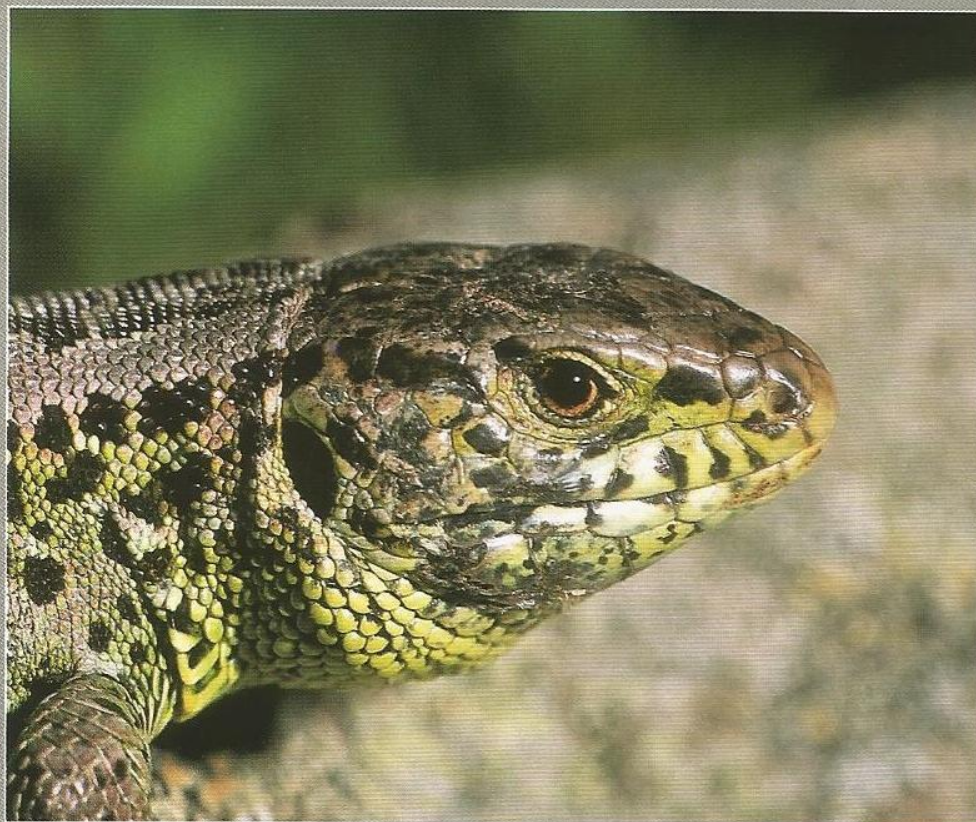
Maschio adulto di lucertola agile, dettaglio del capo (Valle Stura di Demonte, Cuneo)

Comment to the distribution map - The species is only present with certainty in Piedmont (some localities in the Stura di Demonte valley, in the province of Cuneo) and Friuli-Venezia Giulia, (in the Fusine area in Valromana, province of Udine) (LAPINI et al. , 1989; POLIDORI & CARATTI, 1992; SINDACO, 1999b). There are also some old specimens vaguely attributed to the area surrounding Bolzano in Alto Adige (RAHMEL, 1991). The species was only discovered fairly recently in Italy (LAPINI et al. , 1989), with the first specimen being collected in snow-melt waters in Piedmont in the 1960s. The finding, donated to the Natural History Museum "Craveri" in Bra (province of Cuneo), was not published at the time because it was identified as Zootoca vivipara (A. Morisi, ex verbis, 1988). Only after the revision of its species determination was it published (LAPINI et al. , 1989). Recent research in the Maritime Alps in Piedmont has confirmed the presence of the species in previously known sites, as well as identifying another (DI GIA & SINDACO, 2004). This small pocket of distribution is in direct contact with that discovered by POLIDORI & CARATTI (1992) on the French slope of