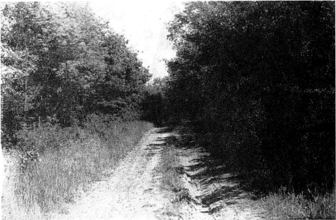
Pl. XVI. Biototypus von Lacerta vivipara Jacquin bei Kunešov in einer Seehöhe von ca. 700 m ü. d. M. Von der Gesamtzahl untersuchter Eidechsen waren 4,3 % von Larven und Nymphen I. ricinus befallen (oben). Biotop von Lacerta vivipara pannonica (Lác & Kluch 1968) unweit von Botány. Die Eidechsen kamen entlang eines Grabens am Waldweg vor. Im Durchschnitt war jedes vierte Exemplar von Larven und Nymphen I. ricinus befallen (unten).